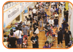
산업관 및 파충류관

100여종의 다양한 곤충의 모습을 더욱 자세히 살펴볼 수 있는 표본 전시관